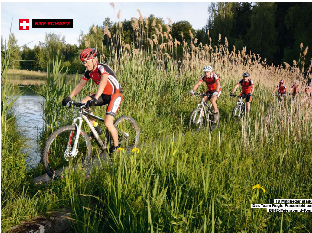
18 Mitglieder stark: Das Team Regio Frauenfeld auf BIKE-Feierabend-Tour.