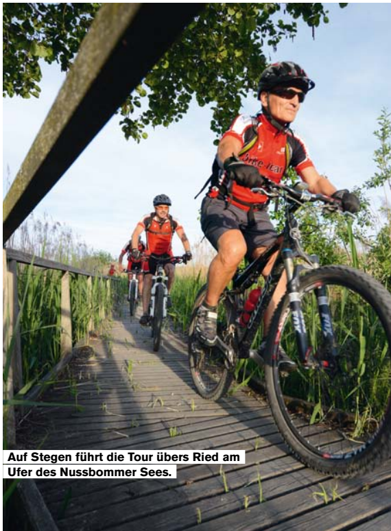
Auf Stegen führt die Tour übers Ried am Ufer des Nussbommer Sees.

den die Bauten vom Kanton übernommen. 1856 ging sie in Privatbesitz über. 1977 wurde eine Stiftung gegründet, die den einstigen Stift kaufte und für 49 Millionen Franken komplett sanierte. Seither ist er beliebter Zufluchtsort für Ruhesuchende und Geniesser. Noch immer wird viel selber hergestellt und angebaut. Auch der Hopfen für das würzige Ittinger Amberbier, das zunächst bei Calanda gebraut wurde. 2004, im Zuge einer Grossakquisition, fiel es jedoch als Mitgift ebenfalls an den holländischen Braukonzern Heineken.