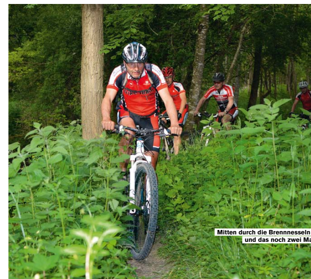
Mitten durch die Brennnesseln – und das noch zwei Mal.

Dass der Kitt vorhanden ist, zeigt alleine die Tatsache, dass 18 Mitglieder zur Feierabend-Tour fürs BIKE-Porträt erschienen. Nur einer nicht im offiziellen Trikot, mit plausibler Entschuldigung (das Lycra sei in der Wäsche). Man wolle schliesslich zeigen, zu wem man gehöre, so Kili. Wie es sich gehört, hat er die Tour zuvor abgefahren und nach passenden Foto-Spots geröntgt. Dass der Brennnessel-Trail in der Giesse, einem Nebenarm in einem Waldstück neben der Thur, dennoch zweimal gefahren werden musste, nahm Kili, wie die meisten der Gruppe, mit Humor. Schliesslich mache stark, was einen nicht umbringt. Zügig ging die Fahrt weiter Richtung Wart auf breiten Strassen durch die Weinberge der Kartause Ittingen. Zugleich die erste namhafte Steigung, die auf 1,2 Kilometern 80 Höhenmeter überwindet. Im Handumdrehen eröffnet sich der Blick von der Kirche auf das weiträumige, gepflegte Anwesen der Kartause. Die 800-jährige Klosteranlage besitzt eine wechselvolle Vergangenheit und zählt zu den sehenswertesten Kulturwerten des Kantons Thurgau. 1848 wur-